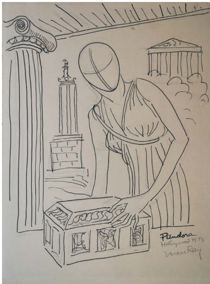
Man Ray, Pandora , 1950, plume et encre de Chine sur traits de crayon sur papier, 40,7 x 30,3 cm. Galerie des Modernes, Paris.