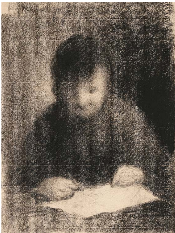
Charles Angrand (1854-1926), Enfant lisant , vers 1896-98, crayon Conté sur papier, 31,6 x 23,9 cm. Galerie Éric Gillis, Bruxelles.